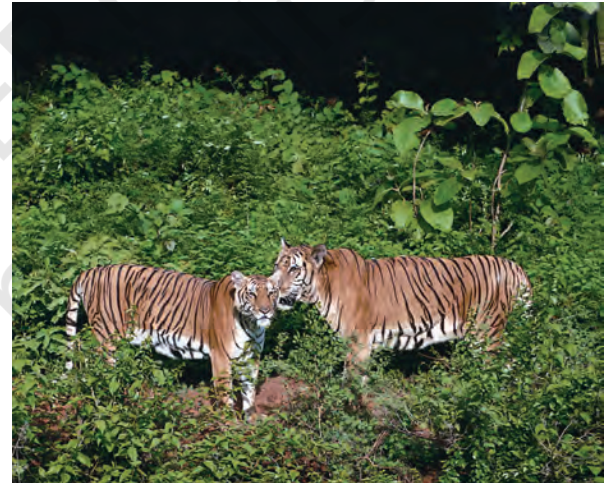
चित्र 1.3 भारत के विभिन्न चिड़ियाघरों में वन्य प्राणी