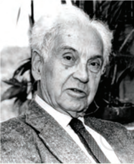
एरनस्ट मेयर (1904 - 2004)

एरनस्ट मेयर का जन्म 5 जुलाई, 1904 में केंपटन, जर्मनी में हुआ था। आप हावर्ड विश्वविद्यालय के विकासपरक जीव वैज्ञानिक थे, जिन्हें '20वीं शती का डार्विन' कहा गया। आप अब तक के 100 महान वैज्ञानिकों में से एक थे। मेयर ने सन् 1953 में हावर्ड विश्वविद्यालय की कला एवं विज्ञान संकाय में नौकरी प्राप्त की और 1975 में एलेक्जेंडर अगासीज प्रोफेसर ऑफ जुलोजी एमीरिटस की पदवी के साथ अवकाश प्राप्त किया। अपने 80 सालों के कार्य जीवन में आपका पक्षी-विज्ञान, वर्गीकरण-विज्ञान, प्राणि-भूगोल, विकास, वर्गिकी तथा जीव विज्ञान के इतिहास एवं दर्शन आदि पर अनुसंधान केंद्रित रहा। आप ने लगभग अकेले ही विकासीय जीव विज्ञान के केंद्रीय प्रश्न जाति विविधता की उत्पत्ति को खड़ा किया, जो कि आज सच है। इसके साथ ही आपने हाल ही में स्वीकृत जीव वैज्ञानिक जाति वर्गिकी की परिभाषा की अगुवाई की। मेयर को तीन पुरस्कार दिए गए, जिन्हें व्यापक तौर पर जीव विज्ञान के तीन ताजों की संज्ञा दी जाती है: 1983 में बालजॉन प्राइज, 1998 में जीव विज्ञान के लिए इंटरनेशनल प्राइज और 1999 में क्राफूर्ड प्राइज। मेयर ने 100 वर्ष की आयु में 2004 को स्वर्गवासी हुए।