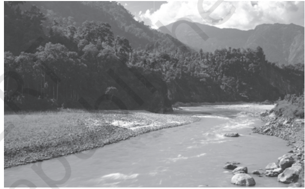
चित्र 3.1 : पर्वतीय क्षेत्र की एक नदी

दिशा से दूसरी दिशा में बहने का कारण बता सकते हैं? उत्तर में हिमालय तथा दक्षिण में पश्चिमी घाट