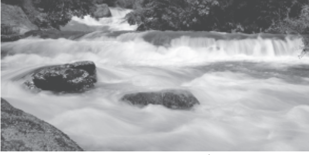
चित्र 3.3 : क्षिप्रिकाएँ

समतल घाटियों, गोखुर झीलें, बाढ़कृत मैदान, गुंफित वाहिकाएँ और नदी के मुहाने पर डेल्टा का निर्माण करती हैं। हिमालय क्षेत्र में इन नदियों का रास्ता टेढ़ा-मेढ़ा है, परंतु मैदानी क्षेत्र में इनमें सर्पाकार मार्ग में बहने की प्रवृत्ति पाई जाती है और अपना रास्ता बदलती रहती हैं। कोसी नदी, जिसे बिहार का शोक (Sorrow of Bihar) कहते हैं, अपना मार्ग बदलने के लिए कुख्यात रही है। यह नदी पर्वतों के ऊपरी क्षेत्रों से भारी मात्रा में अवसाद लाकर मैदानी भाग में जमा करती है। इससे नदी मार्ग अवरूद्ध हो जाता है व परिणामस्वरूप नदी अपना मार्ग बदल लेती है। कोसी नदी ऊपरी पर्वतीय क्षेत्र से इतनी भारी मात्रा में अवसाद क्यों लाती है? क्या आप सोचते हैं कि सामान्यतः नदियों में और विशेष तौर पर कोसी नदी में जल का बहाव व मात्रा एक समान रहती है या घटती-बढ़ती रहती है? नदी में कब जल की मात्रा अत्यधिक होती है? बाढ़ के सकारात्मक व नकारात्मक प्रभाव क्या हैं?