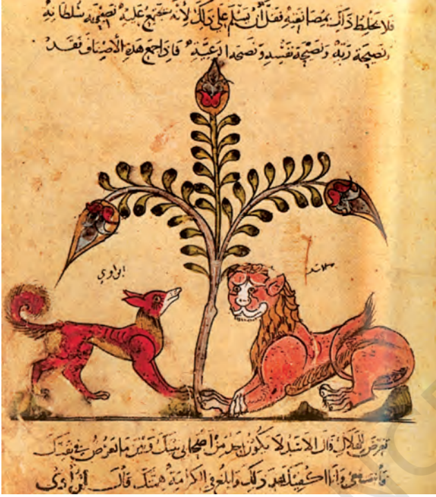
13वीं शताब्दी की अरबी पांडुलिपि का एक लघुचित्र, जिसमें दिमना शेर (असद) से बात कर रहा है।

चार पंक्तियों वाला छंद होता है, जिसमें पहली दो पंक्तियाँ भूमिका बाँध देती हैं, तीसरी पंक्ति बढ़िया तरीके से सधी होती है, और चौथी पंक्ति मुख्य बात प्रस्तुत करती है। इसके रूप के विपरीत, रुबाई की विषय-वस्तु अप्रतिबंधित होती है। इसका इस्तेमाल प्रियतम अथवा प्रेयसी के सौंदर्य का बखान करने, संरक्षक की प्रशंसा करने, अथवा दार्शनिक के विचारों को अभिव्यक्त करने के लिए किया जा सकता है। रुबाई (बहुवचन रुबाइयात है) उमर खय्याम के हाथों अपनी पराकाष्ठा पर पहुँच गई। उमर खय्याम (1048-1131) एक खगोल वैज्ञानिक और गणितज्ञ भी थे, जो विभिन्न समयों पर बुखारा, समरकंद और इस्फाहान में रहे थे।