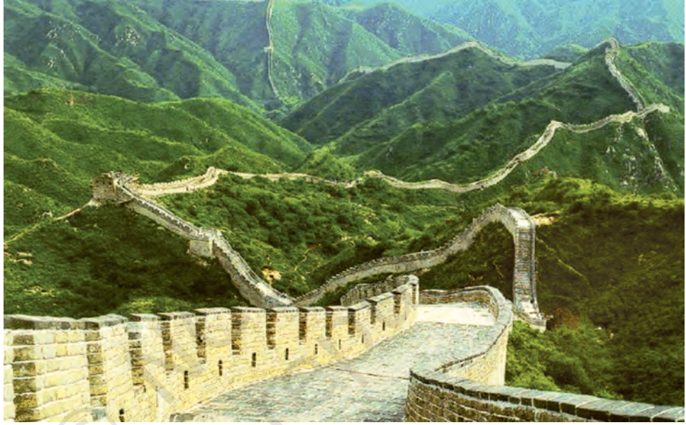
चीन की महान दीवार।

स्थायी समाज कमजोर पड़ने लगे। उन्होंने कृषि को अव्यवस्थित कर दिया और नगरों को लूटा। दूसरी ओर यायावर, लूटपाट कर संघर्ष क्षेत्र से दूर भाग जाते थे जिससे उन्हें बहुत कम हानि होती थी। अपने संपूर्ण इतिहास में चीन को इन यायावरों से विभिन्न शासन-कालों में बहुत अधिक क्षति पहुँची। यहाँ तक कि आठवीं शताब्दी ई.पू. से ही अपनी प्रजा की रक्षा के लिए चीनी शासकों ने किलेबंदी करना प्रारंभ कर दिया था। तीसरी शताब्दी ई.पू. से इन किलेबंदियों का एकीकरण सामान्य रक्षात्मक ढाँचे के रूप में किया गया जिसे आज 'चीन की महान दीवार' के रूप में जाना जाता है। उत्तरी चीन के कृषक समाजों पर यायावरों द्वारा लगातार हुए हमलों और उनसे पनपते अस्थिरता और भय का यह एक प्रभावशाली चाक्षुष साक्ष्य है।