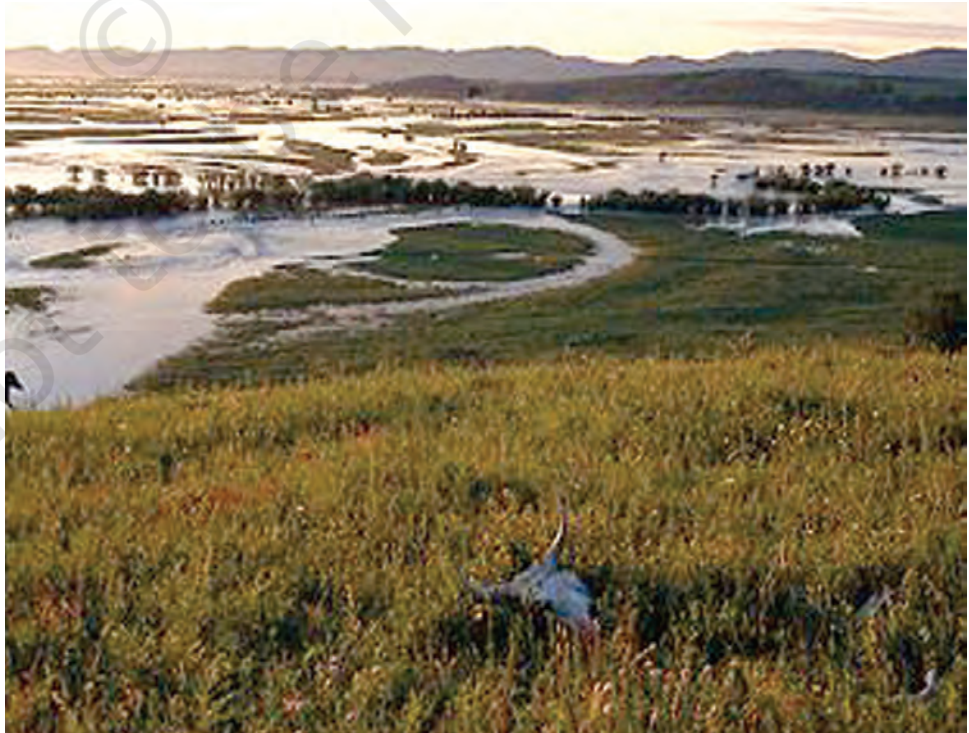
ओनोन नदी के मैदान में बाढ़।

मंगोल विविध जनसमुदाय का एक निकाय था। ये लोग पूर्व में तातार, खितान और मंचू लोगों से और पश्चिम में तुर्की कबीलों से भाषागत समानता होने के कारण परस्पर सम्बद्ध थे। कुछ मंगोल पशुपालक थे और कुछ शिकारी संग्राहक थे। पशुपालक घोड़ों, भेड़ों और कुछ हद तक अन्य पशुओं जैसे बकरी और ऊँटों को भी पालते थे। उनका यायावरीकरण मध्यएशिया की चारण भूमि (स्टेपीज) में हुआ जोकि आज के आधुनिक मंगोलिया राज्य का भूभाग है। इस क्षेत्र का परिदृश्य आज जैसा ही अत्यंत मनोरम था और क्षितिज अत्यंत विस्तृत और लहरिया मैदानों से घिरा था जिसके पश्चिमी भाग में अल्ताई पहाड़ों की बर्फ़ीली चोटियाँ थीं। दक्षिण भाग में शुष्क गोबी का मरुस्थल इसके उत्तर और पश्चिम क्षेत्र में ओनोन और सेलेंगा जैसी नदियों और बर्फ़ीली पहाड़ियों से निकले सैकड़ों झरनों के पानी से सिंचित हो रहा था। पशुचारण के लिए यहाँ पर अनेक हरी घास के मैदान और प्रचुर मात्रा में छोटे-मोटे शिकार अनुकूल ऋतुओं में उपलब्ध हो जाते थे। शिकारी-संग्राहक लोग, पशुपालक कबीलों के आवास-क्षेत्र के उत्तर में साइबेरियाई वनों में रहते