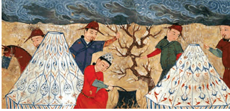
कुबलाई खान और चाबी, शिविर में