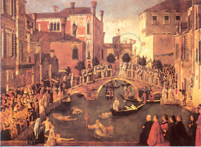
जी. बेलिनी का दि रिक्वरी ऑफ दि रेलिक ऑफ दि होली क्रॉस (पवित्र क्रॉस के स्मृतिशेष की पुनर्प्राप्ति) चित्र 1370 की एक घटना की याद में 1500 में बना परन्तु इसमें चित्रण 15वीं शताब्दी के वेनिस का है।

सबसे पहले मैं आपको यह बताऊँगा कि हमारे पूर्वजों ने ऐसा नियम क्यों बनाया कि सामान्य जनता को नागरिक