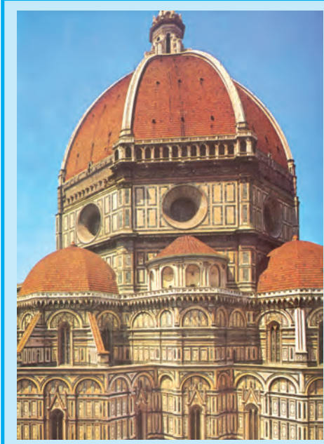
दी ड्यूमा (Duomo), फ्लोरेंस के कथीड्रल का गुम्बद, इसका डिजाइन ब्रुनेलेशी ने बनाया।

(Filippo Brunelleschi, 1337-1446) जिन्होंने फ्लोरेंस के भव्य गुम्बद (Duomo) का परिरूप प्रस्तुत किया था, ने अपना पेशा एक मूर्तिकार के रूप में शुरू किया। इस काल में एक और अनोखा बदलाव आया। अब कलाकार की पहचान उसके नाम से होने लगी, न कि पहले की तरह उसके संघ या श्रेणी (गिल्ड) के नाम से।