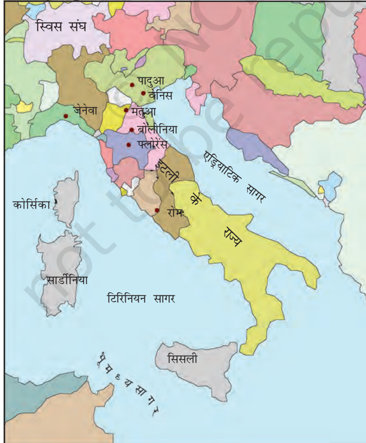
मानचित्र 1 : इटली के राज्य।

बाइज़ेंटाइन साम्राज्य और इस्लामी देशों के बीच व्यापार के बढ़ने से इटली के तटवर्ती बंदरगाह पुनर्जीवित हो गए। बारहवीं शताब्दी से जब मंगोलों ने चीन के साथ 'रेशम-मार्ग' (देखिए विषय 5) से व्यापार आरंभ किया तो इसके कारण पश्चिमी यूरोपीय देशों के व्यापार को बढ़ावा मिला। इसमें इटली के नगरों ने मुख्य भूमिका निभाई। अब वे अपने को एक शक्तिशाली साम्राज्य के अंग