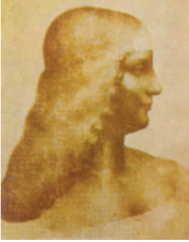
इसाबेला दि इस्ते।

फेदेले की रचनाओं से यह बात सामने आती है कि इस काल में सब लोग शिक्षा को बहुत महत्त्व देते थे। वे वेनिस की अनेक लेखिकाओं में से एक थीं जिन्होंने गणतंत्र की आलोचना “स्वतंत्रता की एक बहुत सीमित परिभाषा निर्धारित करने के लिए की, जो महिलाओं की अपेक्षा पुरुषों की इच्छा का ज्यादा समर्थन करती थी।” इस काल की एक अन्य प्रतिभाशाली महिला मंटुआ की मार्चिसा ईसाबेला दि इस्ते (Isabella d' Este, 1474-1539) थीं। उन्होंने अपने पति की अनुपस्थिति में अपने राज्य पर शासन किया। यद्यपि मंटुआ, एक छोटा राज्य था तथापि उसका राजदरबार अपनी बौद्धिक प्रतिभा के लिए प्रसिद्ध था। महिलाओं की रचनाओं से उनके इस दृढ़ विश्वास का पता चलता है कि उन्हें पुरुष-प्रधान समाज में अपनी पहचान बनाने के लिए अधिक आर्थिक स्वायत्तता, संपत्ति और शिक्षा मिलनी चाहिए।