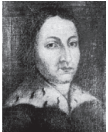
कोपरनिकस का आत्म-चित्र।

खगोलीय का अर्थ दैवी या स्वर्गीय है जबकि पार्थिव में दुनियावी गुण अंतर्निहित है।