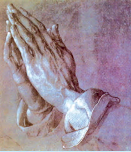
ड्यूरर का तूलिका चित्र 1508- “प्रार्थना रत हस्त”

उस काल के लोगों के विचार को आकार देने का साधन मानवतावादियों के लिए केवल औपचारिक शिक्षा ही नहीं थी। कला, वास्तुकला और ग्रंथों ने मानवतावादी विचारों को फैलाने में प्रभावी भूमिका निभाई।