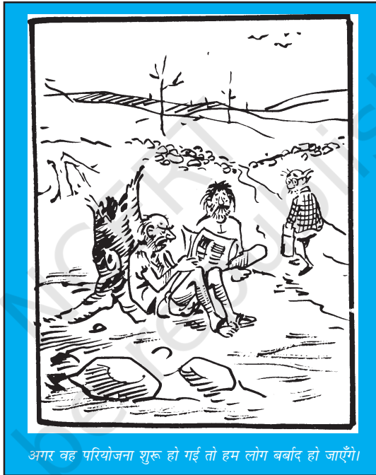
अगर वह परियोजना शुरू हो गई तो हम लोग बर्बाद हो जाएँगे।

पचास के दशक से प्रारंभ करते हुए भारत में विकास के लिए पंचवर्षीय योजनाओं की एक श्रृंखला बनी और इनमें भाखड़ा नंगल बांध, देश के विभिन्न हिस्सों में इस्पात संयंत्रों की स्थापना, खनन, उर्वरक उत्पादन और कृषि तकनीकों में सुधार जैसी अनेक वृहत परियोजनाएँ शामिल थीं। उम्मीद की गई कि यह बहुआयामी रणनीति आर्थिक रूप से प्रभावकारी होगी और देश की संपदा में महत्वपूर्ण बढ़ोतरी होगी। यह उम्मीद भी की गई कि इस बढ़ोतरी से आने वाली संपन्नता धीरे-धीरे समाज के सबसे गरीब तबके तक रिसकर पहुँचेगी और असमानता को कम करने में सहायक होगी। विज्ञान की ताजातरीन खोजों को अपनाने और नवीनतम तकनीकों पर काफी विश्वास किया गया था। भारतीय प्रौद्योगिकी संस्थान जैसे नए शैक्षणिक संस्थान स्थापित किए गए और उन्नत देशों के ज्ञान तक पहुँचने के लिहाज से उनके साथ सहयोग करने को उच्च प्राथमिकता मिली। यह विश्वास किया गया कि विकास की प्रक्रिया समाज को अधिक आधुनिक और प्रगतिशील बनाएगी और उसे उन्नति के पथ पर ले जाएगी।