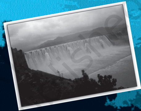
चित्र सरदार सरोवर नर्मदा निगम लि. से साभार

इस अध्याय में हम विकास की सामान्य समझ से चर्चा शुरू करेंगे और देखेंगे कि विकास की इस समझ ने क्या समस्याएँ पेश की हैं? बाद वाले खंडों में हम उन तरीकों को खोजेंगे जिनसे इन समस्याओं को हल किया जा सकता है। हम विकास के बारे में सोचने के कुछ वैकल्पिक तरीकों पर भी चर्चा करेंगे। इस अध्याय से गुज़रने के बाद आप-