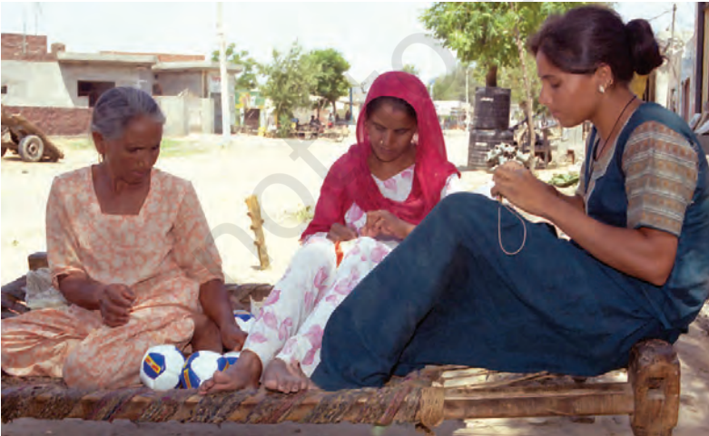
लुधियाना के एक घर में एक बड़ी बहुराष्ट्रीय कंपनी के लिए फुटबाल-निर्माण का चित्र

इस प्रकार, हम देखते हैं कि बहुराष्ट्रीय कंपनियाँ कई तरह से अपने उत्पादन कार्य का प्रसार कर रही हैं और विश्व के कई देशों की स्थानीय कंपनियों के साथ पारस्परिक संबंध स्थापित कर रही हैं। स्थानीय कंपनियों के साथ साझेदारी द्वारा, आपूर्ति के लिए स्थानीय कंपनियों का इस्तेमाल करके और स्थानीय कंपनियों से निकट प्रतिस्पर्धा करके अथवा उन्हें खरीद कर बहुराष्ट्रीय कंपनियाँ दूरस्थ स्थानों के उत्पादन पर अपना प्रभाव जमा रही हैं। परिणामतः दूर-दूर स्थानों पर फैला उत्पादन परस्पर संबंधित हो रहा है।