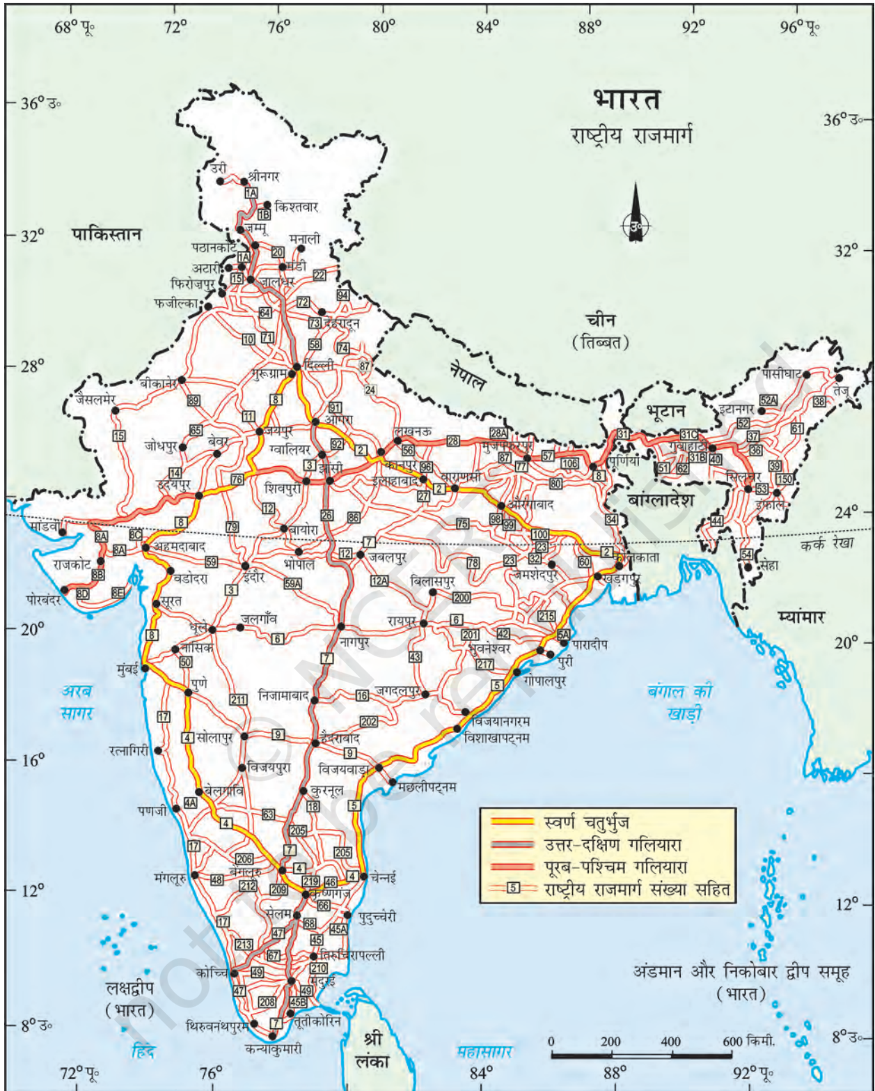
भारत - राष्ट्रीय राजमार्ग