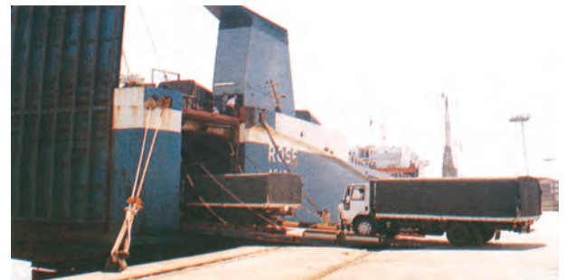
चित्र 7.6 – मुंबई पत्तन में जहाज पर ट्रकों को ले जाते हुए

मुंबई वृहत्तम पत्तन है जिसके प्राकृतिक खुले, विस्तृत व सुचारु पोताश्रय हैं। मुंबई पत्तन के अधिक परिवहन को ध्यान में रखकर इसके सामने जवाहरलाल नेहरू पत्तन विकसित किया गया जो इस पूरे क्षेत्र को एक समूह