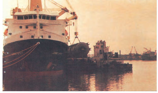
चित्र 7.8 - बड़े आकार के कार्गो को उठाने-रखने की सुविधाओं से युक्त तूतीकोरन पत्तन

पूर्वी तट के साथ तमिलनाडु में दक्षिण-पूर्वी छोर पर तूतीकोरन पत्तन है। यह एक प्राकृतिक पोताश्रय है तथा इसकी पृष्ठभूमि भी अत्यंत समृद्ध है। अतः यह पत्तन हमारे पड़ोसी देशों जैसे - श्रीलंका, मालदीव आदि तथा भारत के तटीय क्षेत्रों की भिन्न वस्तुओं के व्यापार को संचालित करता है। चेन्नई हमारे देश का प्राचीनतम कृत्रिम पत्तन है। व्यापार की मात्रा तथा लदे सामान के संदर्भ में इसका मुंबई के बाद दूसरा स्थान है। विशाखापट्टनम स्थल से घिरा, गहरा व सुरक्षित पत्तन है। प्रारम्भ में यह पत्तन लौह-अयस्क निर्यातक के रूप में विकसित किया गया था। ओडिशा में स्थित पारादीप पत्तन विशेषतः लौह-अयस्क का निर्यात करता है। कोलकाता एक अंतःस्थलीय नदीय (Riverine) पत्तन है। यह पत्तन गंगा-ब्रह्मपुत्र बेसिन के वृहत् व समृद्ध पृष्ठभूमि को सेवाएँ प्रदान करता है। ज्वारीय (Tidal) पत्तन होने के कारण तथा हुगली के तलछट जमाव से इसे नियमित रूप से साफ करना पड़ता है। कोलकाता पत्तन पर बढ़ते व्यापार को कम करने हेतु हल्दिया सहायक पत्तन के रूप में विकसित किया गया है।