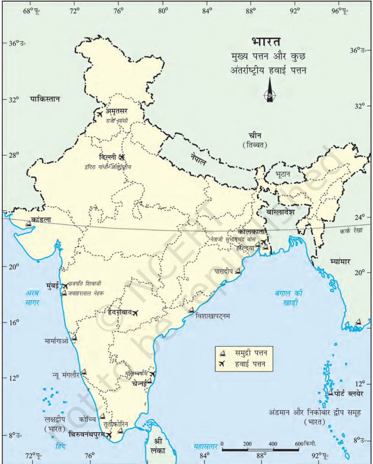
भारत - मुख्य पत्तन और कुछ अंतर्राष्ट्रीय हवाई पत्तन