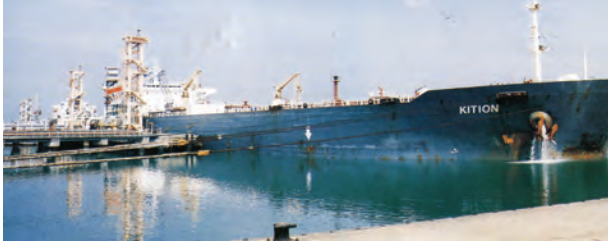
चित्र 7.7 - न्यू-मंगलौर पत्तन पर टैंकर द्वारा कच्चे तेल का निर्वहन

पत्तन की सुविधा भी प्रदान कर सके। लौह-अयस्क के निर्यात के संदर्भ में मारमागाओ पत्तन देश का महत्वपूर्ण पत्तन है। यहाँ से देश के कुल निर्यात का आधा (50 प्रतिशत) लौह-अयस्क निर्यात किया जाता है। कर्नाटक में स्थित न्यू-मैंगलोर पत्तन कुद्रेमुख खानों से निकले लौह-अयस्क का निर्यात करता है। सुदूर दक्षिण-पश्चिम में कोची पत्तन है; यह एक लैगून के मुहाने पर स्थित एक प्राकृतिक पोताश्रय है।