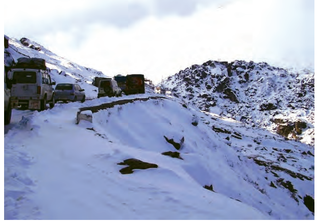
चित्र 7.4 – उत्तरी-पूर्वी सीमा सड़क पर यातायात (अरुणाचल प्रदेश)

सड़क निर्माण में प्रयुक्त पदार्थ के आधार पर भी सड़कों को कच्ची व पक्की सड़कों में वर्गीकृत किया जाता है। पक्की सड़कें, सीमेंट, कंक्रीट व तारकोल द्वारा निर्मित होती हैं, अतः ये बारहमासी सड़कें हैं। कच्ची सड़कें वर्षा ऋतु में अनुपयोगी हो जाती हैं।