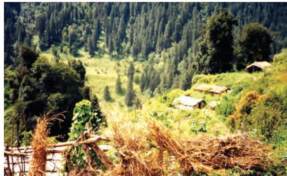
चित्र 16.2 वन्यजीवन का एक दृश्य

उद्योग इन वनों को अपनी फैक्ट्री के लिए कच्चे माल का स्रोत मात्र ही मानते हैं। निहित स्वार्थ से लोगों का एक बड़ा वर्ग सरकार से उद्योगों के लिए कच्चे माल को बहुत कम मूल्य पर प्राप्त करने में लगा रहता है। क्योंकि स्थानीय निवासियों की अपेक्षा इन व्यक्तियों की पहुँच सरकार में काफी ऊपर तक होती है, अतः उन्हें उस क्षेत्र के संपोषित विकास में कोई रुचि नहीं होती। उदाहरण के लिए, किसी वन के टीक के सभी वृक्षों को काटने के बाद, वे दूरस्थ वनों से टीक प्राप्त करने लगेंगे। उन्हें इस बात से कोई मतलब नहीं है कि वे इनका इष्टतम उपयोग सुनिश्चित करें जिससे कि वह आगे आने वाली पीढ़ियों को भी उपलब्ध हो सके। आपके विचार में लोगों को इस प्रकार व्यवहार करने से कैसे रोका जा सकता है?