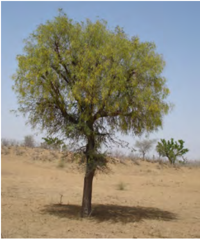
चित्र 16.3 खेजरी वृक्ष

अध्ययनों ने इस बात को स्थापित कर दिया है कि वनों के परंपरागत उपयोग के तरीकों के विरुद्ध पूर्वाग्रह का कोई ठोस आधार नहीं है। उदाहरणतः, विशाल हिमालय राष्ट्रीय उद्यान के सुरक्षित क्षेत्र में एल्पाइन के वन हैं जो भेड़ों के चरागाह थे। घुमंतु (खानाबदोश) चरवाहे प्रत्येक वर्ष ग्रीष्मकाल में अपनी भेड़ें घाटी से इस क्षेत्र में चराने के लिए ले जाते थे। परंतु इस राष्ट्रीय उद्यान की स्थापना के बाद इस परंपरा को रोक दिया गया। अब यह देखा गया है कि पहले तो यह घास बहुत लंबी हो जाती है, फिर लंबाई के कारण जमीन पर गिर जाती है जिससे नयी घास की वृद्धि रुक जाती है। संरक्षित क्षेत्रों में स्थानीय निवासियों को बलपूर्वक रोकने की प्रबंधन नीति संभवतः लंबे समय तक सफल नहीं हो पाई। किसी भी प्रकार से वनों को होने वाली क्षति के लिए केवल स्थानीय निवासियों को ही उत्तरदायी ठहराना ठीक नहीं है। हम औद्योगिक आवश्यकताओं एवं विकास परियोजनाओं जैसे कि सड़क एवं बाँध निर्माण से वनों के विनाश अथवा इसको होने वाली क्षति से आँखें नहीं मूँद सकते। इन संरक्षित क्षेत्रों में पर्यटकों के द्वारा अथवा उनकी सुविधा के लिए की गई व्यवस्था से होने वाली क्षति के बारे में भी विचार करना होगा।