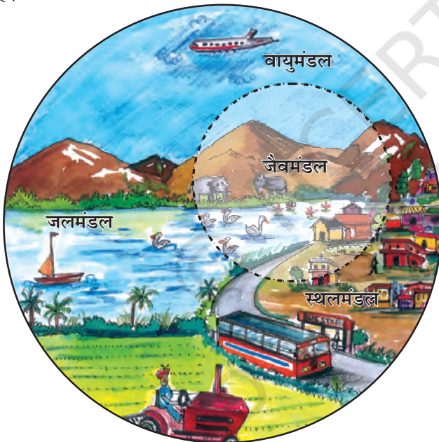
चित्र 1.2 : पर्यावरण के क्षेत्र

स्थलमंडल वह क्षेत्र है, जो हमें वन, कृषि एवं मानव बस्तियों के लिए भूमि, पशुओं को चरने के लिए घासस्थल प्रदान करता है। यह खनिज संपदा का भी एक स्रोत है।