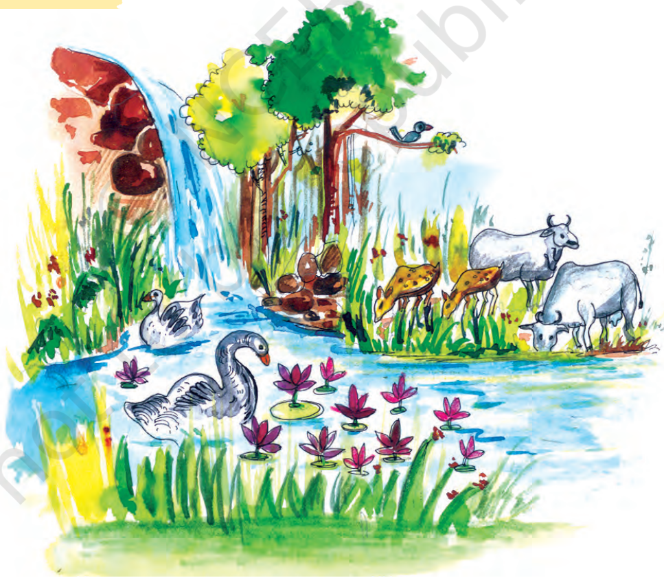
चित्र 1.3 : एक ताल का पारितंत्र

तभी जैसलमेर के रहने वाले हीरा ने आश्चर्य से कहा, “हमारे यहाँ वर्षा होती ही नहीं है। हमें तो दूर-दूर तक केवल कीकर एवं रेत ही नज़र आती है।” “लेकिन वहाँ ऊँट भी तो मिलते हैं,” रवि ने कहा।