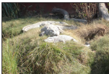
चित्र 8.12 : मगर