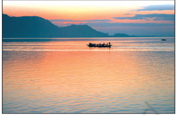
चित्र 8.7 : ब्रह्मपुत्र नदी

गंगा एवं ब्रह्मपुत्र के मैदान, पर्वत एवं हिमालय के गिरिपाद तथा सुंदरवन डेल्टा