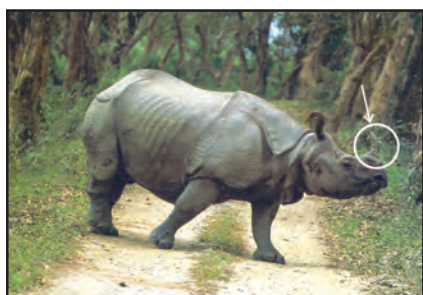
चित्र 8.11 : एक सींग वाला गैंडा

बेसिन में विविध प्रकार के वन्यजीव पाए जाते हैं। इनमें हाथी, बाघ, हिरण एवं बंदर आदि सामान्य रूप से पाए जाने वाले जीव हैं। एक सींग वाला गैंडा ब्रह्मपुत्र के मैदानों में पाया जाता है (चित्र 8.11)। डेल्टा क्षेत्र में बंगाल टाइगर, मगर एवं घड़ियाल पाए जाते हैं (चित्र 8.12)। नदी के साफ़ जल, झील एवं बंगाल की खाड़ी में प्रचुर मात्रा में जलीय जीव पाए जाते हैं। रोहू, कतला एवं हिलसा मछलियों की सबसे लोकप्रिय प्रजातियाँ हैं। मछली एवं चावल इस क्षेत्र में रहने वाले लोगों का मुख्य आहार है।