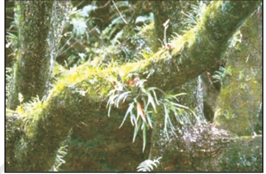
चित्र 8.3 : अमेज़न वन

इन प्रदेशों में अत्यधिक वर्षा के कारण यहाँ की भूमि पर सघन वन उग जाते हैं (चित्र 8.3)। वन इतने सघन होते हैं कि पत्तियों तथा शाखाओं से 'छत' सी बन जाती है जिसके कारण सूर्य का प्रकाश धरातल तक नहीं पहुँच पाता है। यहाँ की भूमि प्रकाश रहित एवं नम बनी रहती है। यहाँ केवल वही वनस्पति पनप सकती है जिसमें