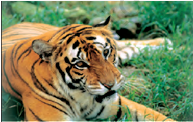
चित्र 8.14 : मानस वन्य प्राणी अभयवन में बाघ

बेसिन में यातायात का सुविकसित तंत्र उपस्थित है। आप देख सकते हैं कि गंगा-ब्रह्मपुत्र बेसिन में यातायात के चार मार्ग सुविकसित हैं। मैदानी इलाकों के लोग सड़कमार्ग एवं रेलमार्ग द्वारा एक स्थान से दूसरे स्थान तक जाते हैं। नदी के तटीय क्षेत्रों में जलमार्ग यातायात का प्रभावशाली माध्यम है। कोलकाता हुगली नदी पर स्थित एक महत्वपूर्ण पत्तन है। मैदानी क्षेत्र में कई बड़े हवाई पत्तन भी स्थित हैं।