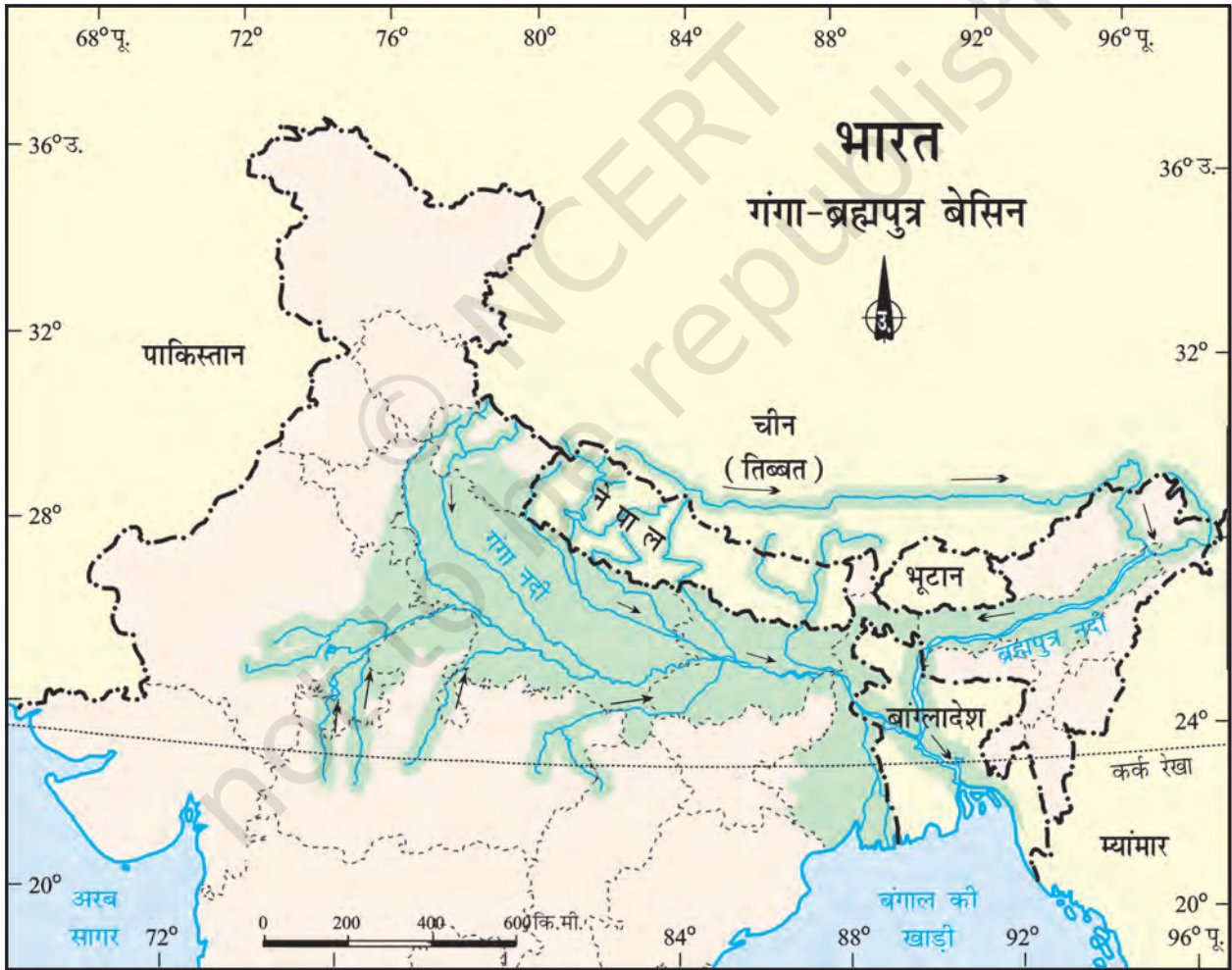
चित्र 8.8 : गंगा-ब्रह्मपुत्र बेसिन

मानव-पर्यावरण अन्योन्यक्रिया: उष्णकटिबंधीय एवं उपोष्ण प्रदेश 59