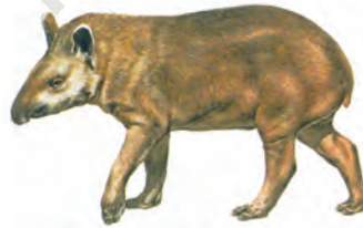
चित्र 8.4 : टैपीर

विभिन्न प्रजातियाँ भी इन वनों में पाई जाती हैं। मगर, साँप, अजगर तथा एनाकोंडा एवं बोआ कुछ ऐसी ही प्रजातियाँ हैं। इसके अतिरिक्त हज़ारों कीड़े-मकोड़े भी इस बेसिन में निवास करते हैं। मांस खाने वाली पिरान्या मत्स्य समेत मछलियों की विभिन्न प्रजातियाँ भी अमेज़न नदी में पाई जाती हैं। इस प्रकार जीवों की विविधता की दृष्टि से यह बेसिन असाधारण रूप से समृद्ध है।