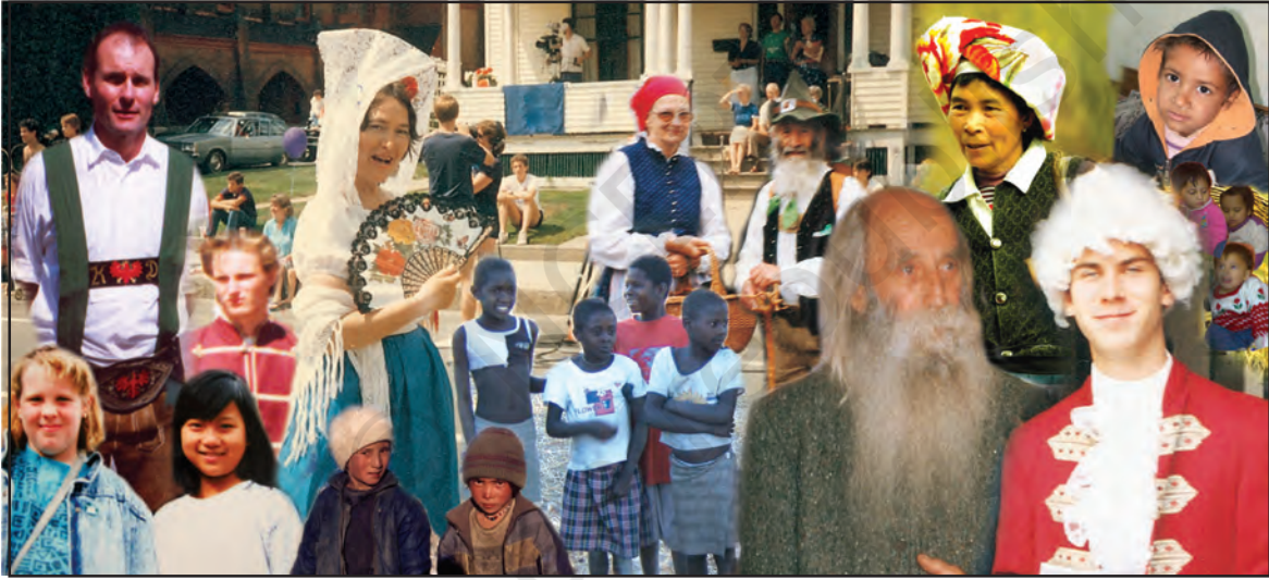
चित्र 8.11 : विश्व के विभिन्न भागों के निवासी

रेणुका बहुत उत्साहित थी। उसके चाचा श्रीकांत लगभग चार महीने के बाद आज घर में थे। वह एक वन्यजीव फोटोग्राफर थे तथा बहुत यात्रा करते थे। बहुत छोटी उम्र से ही रेणुका की रुचि वन्यजीव एवं वनों में थी जब उसके चाचा ने प्रकृति संबंधी पुस्तकों से उसका परिचय कराया। दूरस्थ भूस्थल एवं वहाँ रहने वाले लोगों की तसवीरें उसे हमेशा आकर्षित करती थी।