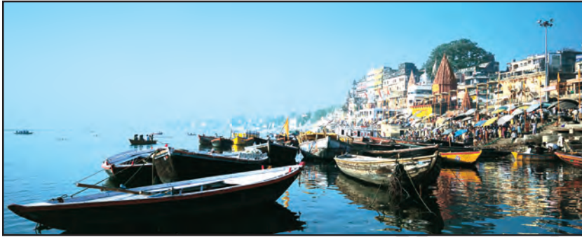
चित्र 8.13 : गंगा नदी के तट पर स्थित वाराणसी शहर

गंगा-ब्रह्मपुत्र के मैदानों में कई बड़े शहर एवं कस्बे स्थित हैं। इलाहाबाद, कानपुर, वाराणसी, लखनऊ, पटना एवं कोलकाता जैसे 10 लाख से अधिक आबादी वाले शहर गंगा नदी के तट पर ही स्थित हैं (चित्र 8.13)। इन शहरों तथा यहाँ स्थित उद्योगों का गंदा पानी बहकर नदी में ही जाता है जिससे नदी प्रदूषित होती है।