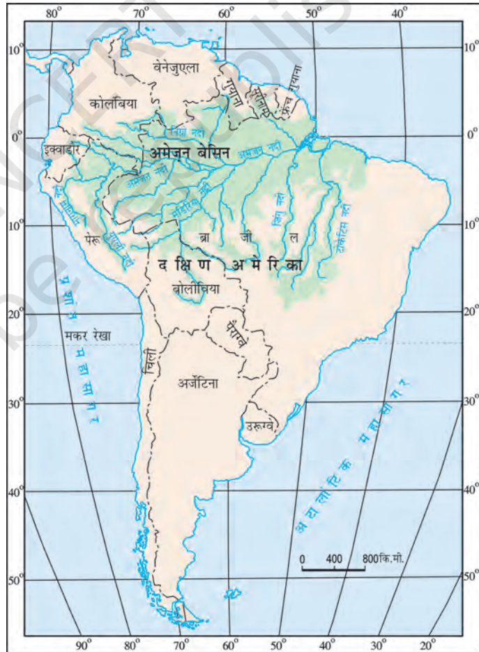
चित्र 8.2 : दक्षिण अमेरिका में अमेज़न बेसिन

क्या आप इस बेसिन में स्थित उन देशों के नाम बता सकते हैं जिनसे भूमध्य रेखा गुजरती है?