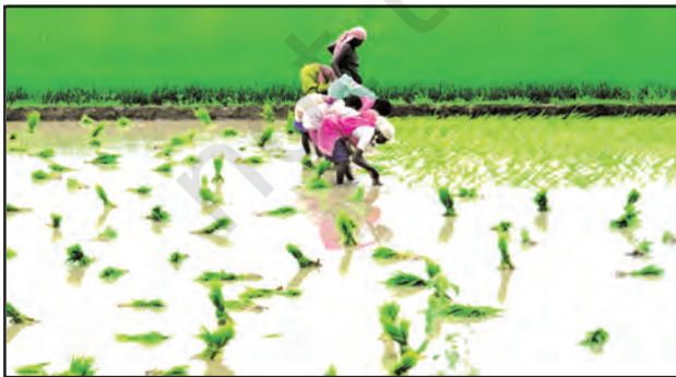
चित्र 8.9 : धान की कृषि

विभिन्न भू-आकृतियों के अनुसार वनस्पति में भी विभिन्नता पायी जाती है। गंगा-ब्रह्मपुत्र के मैदानों में सागवान, साखू एवं पीपल के साथ उष्णकटिबंधीय पर्णपाती पेड़ भी पाए जाते हैं। ब्रह्मपुत्र के मैदानी क्षेत्रों में घने बाँस के घने झुरमुट पाए जाते हैं। डेल्टा क्षेत्र मैंग्रोव वन से घिरा है। उत्तराखंड, सिक्किम एवं अरुणाचल प्रदेश की ठंडी जलवायु एवं तीव्र ढाल वाले भागों में चीड़, देवदार एवं फर जैसे शंकुधारी पेड़ पाए जाते हैं।