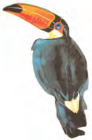
चित्र 8.4 : टूकन

वर्षावन में प्राणिजात की प्रचुरता होती है। टूकन, गुंजन पक्षी, रंगीन पक्षित वाले पक्षी एवं भोजन के लिए बड़ी चोंच वाले विभिन्न प्रकार के पक्षी जो भारत में पाए जाने वाले सामान्य पक्षियों से भिन्न होते हैं यहाँ पाए जाते हैं। प्राणियों में बंदर, स्लॉथ एवं चीटीं खाने वाले टैपीर भी यहाँ पाए जाते हैं। साँप एवं सरीसर्प की