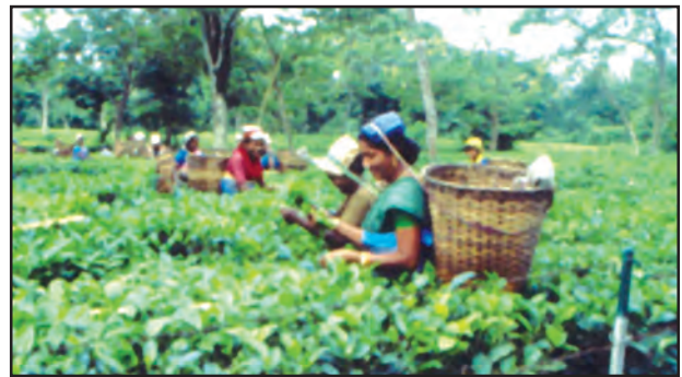
चित्र 8.10 : असम में चाय बागान