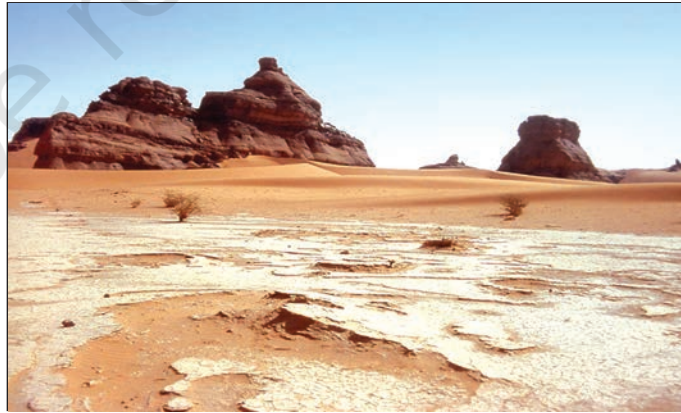
चित्र 9.1 : सहारा रेगिस्तान

विश्व एवं अफ्रीका महाद्वीप के मानचित्र को देखिए। उत्तरी अफ्रीका के बड़े भू-भाग पर फैले सहारा के रेगिस्तान का पता लगाएँ। यह विश्व का सबसे बड़ा रेगिस्तान है। यह लगभग 8.54 लाख वर्ग किलोमीटर के क्षेत्र में फैला हुआ है। क्या आपको याद है कि भारत का क्षेत्रफल 3.2 लाख वर्ग किलोमीटर है? सहारा रेगिस्तान ग्यारह देशों से घिरा हुआ है। ये देश हैं-अल्जीरिया, चाड, मिस्र, लीबिया, माली, मौरितानिया, मोरक्को, नाइजर, सूडान, ट्यूनिशिया एवं पश्चिमी सहारा।