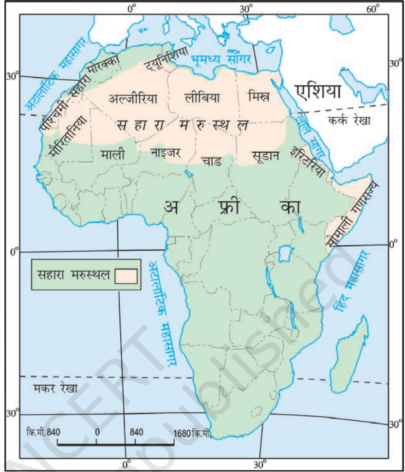
चित्र 9.2 : अफ्रीका महाद्वीप में सहारा

आपको यह जानकर आश्चर्य होगा कि आज का सहारा रेगिस्तान एक समय में पूर्णतया हरा-भरा मैदान था। सहारा की गुफ़ाओं से प्राप्त चित्रों से ज्ञात होता है कि यहाँ नदियाँ तथा मगर पाए जाते थे। हाथी, शेर, जिराफ़, शतुरमुर्ग, भेड़, पशु तथा बकरियाँ सामान्य जानवर थे। परंतु यहाँ के जलवायु परिवर्तन ने इसे बहुत गर्म व शुष्क प्रदेश में बदल दिया है।