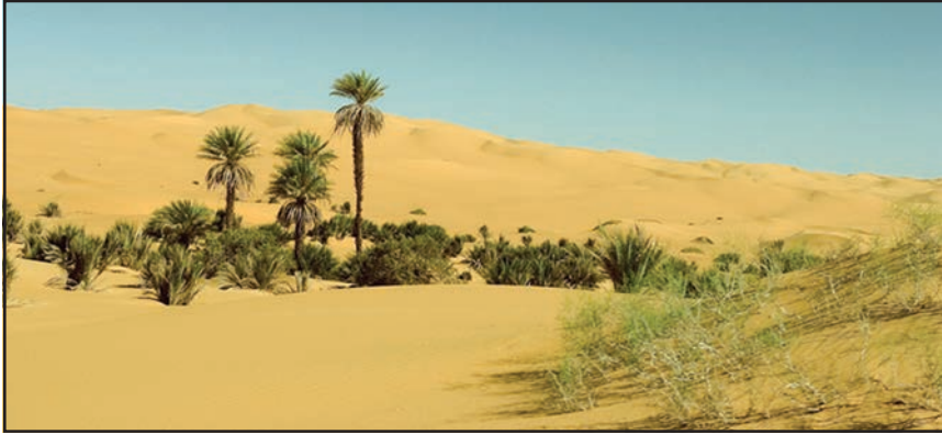
चित्र 9.3 : सहारा रेगिस्तान में मरूद्यान

ऊँट, लकड़बग्घा, सियार, लोमड़ी, बिच्छू, साँपों की विभिन्न जातियाँ एवं छिपकलियाँ यहाँ के प्रमुख जीव-जंतु हैं।