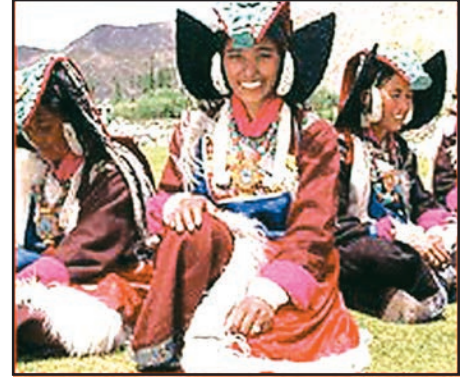
चित्र 9.6 : पारंपरिक वेशभूषा में लद्दाखी महिलाएँ

आधुनिकीकरण के फलस्वरूप यहाँ के जनजीवन में परिवर्तन आ रहा है। लेकिन लद्दाख के लोगों ने शताब्दियों से प्रकृति के साथ समन्वय एवं संतुलन करना सीखा है। जल एवं ईंधन जैसे संसाधनों की कमी के कारण ये आवश्यकतानुसार एवं मितव्ययिता से ही इनका उपयोग करते हैं और कुछ भी व्यर्थ नहीं करते।