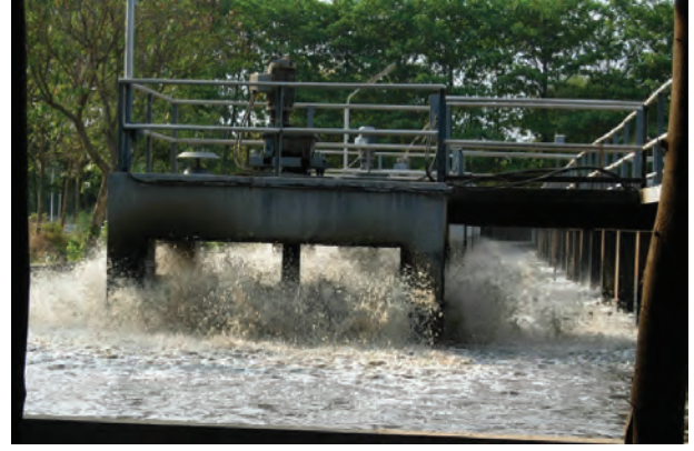
चित्र 18.6 वातित्र

कई घंटों के पश्चात् जल में निलंबित सूक्ष्मजीव टंकी की पेंदी में सक्रिय आपंक के रूप में बैठ जाते हैं। अब शीर्ष भाग से जल को निकाल दिया जाता है। सक्रिय आपंक लगभग 97% जल है। जल को बालू बिछाकर बनाए शुष्कन तलों अथवा मशीनों द्वारा हटा दिया जाता है। शुष्क आपंक का उपयोग खाद के रूप में किया जाता है, जिससे कार्बनिक पदार्थ और पोषक तत्व पुनः मृदा में वापस चले जाते हैं।