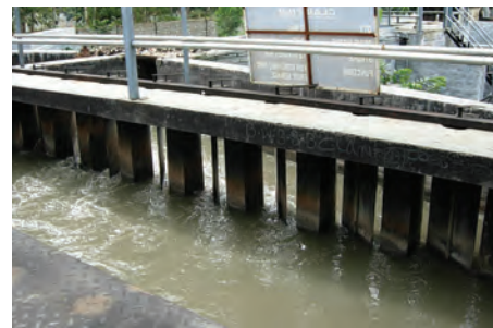
चित्र 18.4 ग्रिट और बालू अलग करने की टंकी