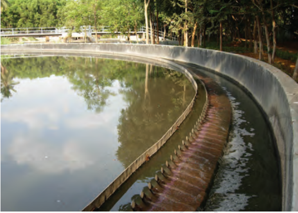
चित्र 18.5 जल अपमथित्र

आपंक को एक पृथक् टंकी में स्थानांतरित किया जाता है, जहाँ यह अवायवीय जीवाणुओं द्वारा अपघटित हो जाता है। इस प्रक्रम में उत्पन्न होने वाली बायोगैस (जैव गैस) का उपयोग ईंधन के रूप में अथवा विद्युत उत्पादन के लिए किया जा सकता है।