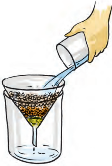
चित्र 18.2 वातित द्रव को फ़िल्टर करने का प्रक्रम