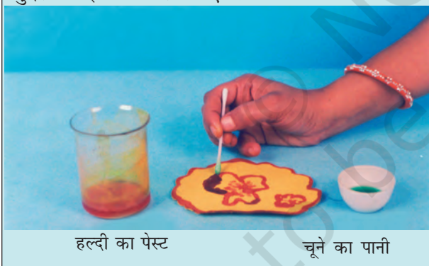
हल्दी का पेस्ट

आप अपनी माताजी के जन्मदिन पर, उनके लिए विशेष बधाई पत्र बना सकते हैं। सादे सफेद कागज़ की शीट पर हल्दी का पेस्ट लगाइए और उसे सुखा लीजिए। रुई के फाहे की सहायता से इस पर चूने के पानी से एक खूबसूरत फूल बनाइए। आपको एक सुंदर बधाई पत्र मिल जाएगा।