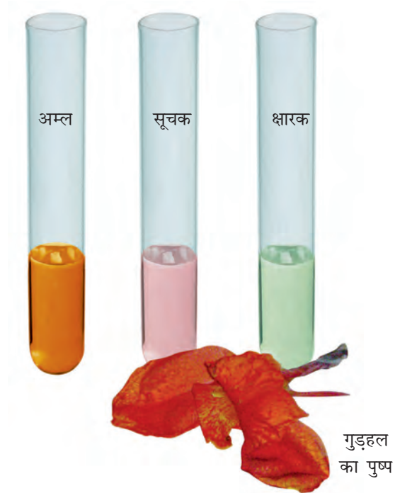
चित्र 5.3 गुड़हल का पुष्प और उससे तैयार किया गया सूचक

आप इन प्राकृतिक सूचकों को बनाकर उनसे अम्लीय, क्षारकीय और उदासीन विलयनों में रंग परिवर्तन देखने का प्रयास कर सकते हैं।