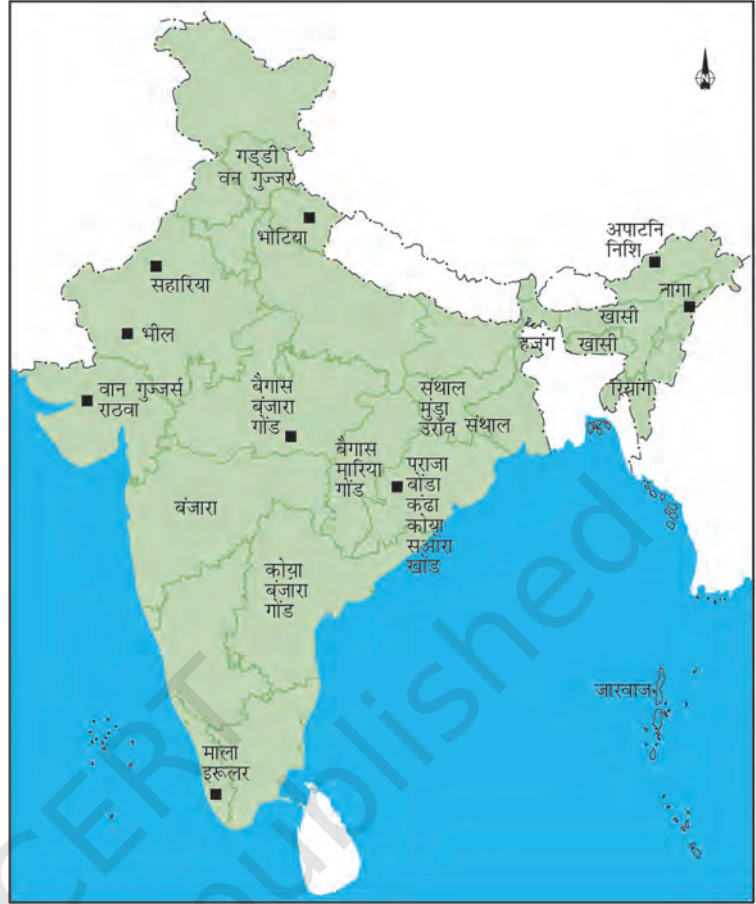
चित्र 3 - भारत में कुछ आदिवासी समुदायों के इलाके।

बहुत सारे आदिवासी समूह जानवर पालकर अपनी ज़िंदगी चलाते थे। वे चरवाहे थे जो मौसम के हिसाब से मवेशियों या भेड़ों के रेवड़ लेकर यहाँ से वहाँ जाते रहते थे। जब एक जगह घास खत्म हो जाती थी तो वे दूसरे इलाके में चले जाते थे। पंजाब के पहाड़ों में रहने वाले वन गुज्जर और आंध्र प्रदेश के लबाड़िया आदि समुदाय गाय-भैंस के झुंड पालते थे। कुल्लू के गद्दी समुदाय के लोग गड़रिये थे और कश्मीर के बकरवाल बकरियाँ पालते थे। अगले साल इतिहास की पाठ्यपुस्तक में आप उनके बारे में विस्तार से पढ़ेंगे।