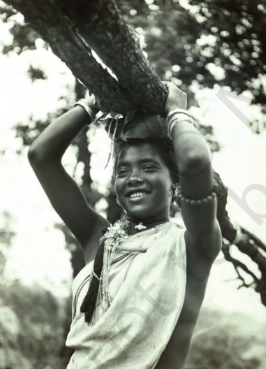
चित्र 4 - ईंधन की लकड़ी ले जाती एक संथाल लड़की, बिहार, 1946

वेरियर ऐल्विन द्वारा लिखित बैगा (1939) और ऐल्विन की अप्रकाशित रचना 'नोट्स ऑन द खोंड्स' (वेरियर ऐल्विन पेपर्स, नेहरू स्मृति संग्रहालय एवं पुस्तकालय) पर आधारित