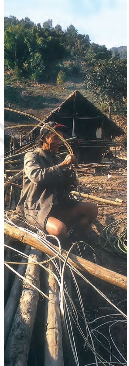
चित्र 5 - पूर्वोत्तर के निशी आदिवासियों के एक गाँव में लट्टों से बना घर। जब ये घर बनाए जाते हैं तो पूरा गाँव मदद करता है।

बेवड़ - मध्य प्रदेश में घुमंतू खेती के लिए इस्तेमाल होने वाला शब्द।