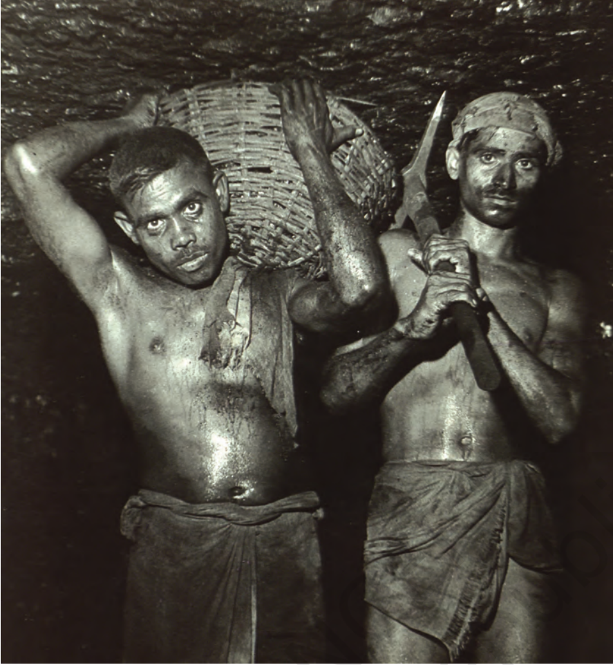
चित्र 10 - बिहार के कोयला खनिक, 1948.

1920 के दशक में बिहार की झरिया और रानीगंज कोयला खदानों में काम करने वाले लगभग 50 प्रतिशत खनिक आदिवासी थे। अँधेरी और दमघोंटू खदानों की गहराई में काम करना न केवल शरीर को तोड़ता था बल्कि यह खतरनाक था। वह अकसर सचमुच जान ले लेता था। 1920 के दशक में देश की कोयला खदानों में हर साल 2,000 से ज्यादा मजदूर मारे जाते थे।