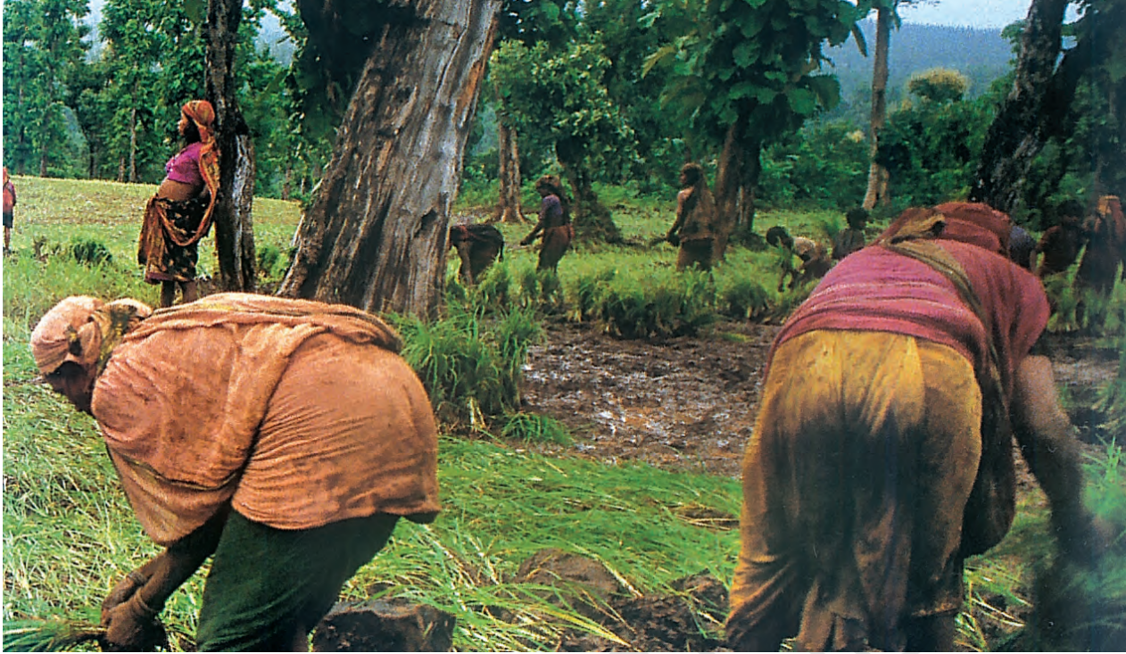
चित्र 6 - गुजरात के एक जंगल में खेती करती भील औरतें।

घुमंतू खेती गुजरात के बहुत सारे वन क्षेत्रों में अभी भी जारी है। आप देख सकते हैं कि यहाँ पेड़ों को काट दिया गया है और खेती के लिए ज़मीन साफ़ कर दी गई है।