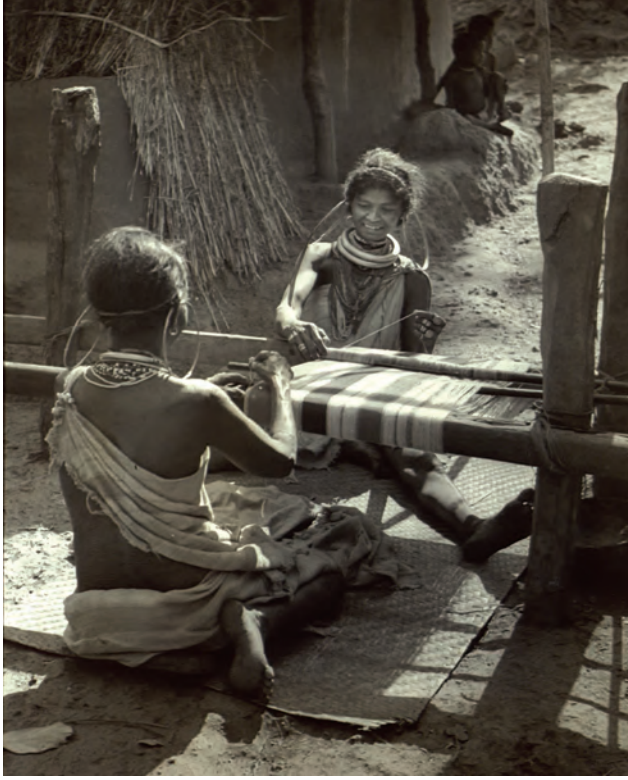
चित्र 8 - गोदासा औरतें बुनाई करती हुई।

अच्छी गुणवत्ता सबको आकर्षित करती थी और भारत का निर्यात तेजी से बढ़ रहा था। जैसे-जैसे बाजार फैला ईस्ट इंडिया कंपनी के अफसर इस माँग को पूरा करने के लिए रेशम उत्पादन पर जोर देने लगे।