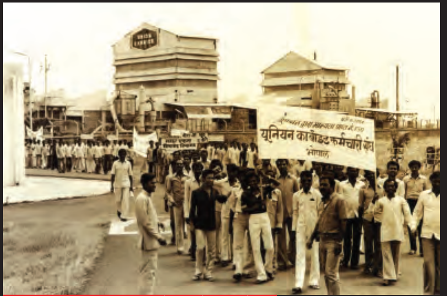
यूनियन कार्बाइड कर्मचारी यूनियन के सदस्यों का आंदोलन

यह तबाही कोई दुर्घटना नहीं थी। यूनियन कार्बाइड ने पैसा बचाने के लिए सुरक्षा उपायों को जानबूझकर नज़रअंदाज़ किया था। 2 दिसंबर की त्रासदी से बहुत पहले भी कारखाने में गैस का रिसाव हो चुका था। इन घटनाओं में एक मजदूर की मौत हुई थी जबकि बहुत सारे घायल हुए थे।