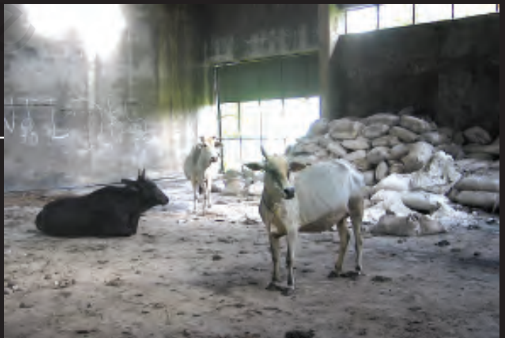
यूनियन कार्बाइड संयंत्र के इर्द-गिर्द बिखरे पड़े रसायनों के बोरे

यूनियन कार्बाइड ने कारखाना तो बंद कर दिया, लेकिन भारी मात्रा में विषैले रसायन वहीं छोड़ दिए। ये रसायन रिस-रिस कर ज़मीन में जा रहे हैं जिससे वहाँ का पानी दूषित हो रहा है। अब यह संयंत्र डाओ कैमिकल नामक कंपनी के कब्जे में है जो इसकी साफ़-सफ़ाई का जिम्मा उठाने को तैयार नहीं है।