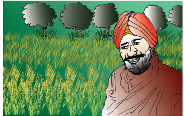
चित्र 4.3 : पंजाब का एक किसान एच.वाई.वी. प्रकारों वाले गेहूँ के एक खेत के सामने, जिस पर हरित क्रांति आधारित है

तत्कालीन प्रधानमंत्री इंदिरा गांधी ने जुलाई, 1968 में 'गेहूँ क्रांति' शीर्षक से एक विशेष डाक टिकट जारी कर कृषि के क्षेत्रक में हरित क्रांति की प्रभावशाली प्रगति को आधिकारिक रूप से दर्ज किया। गेहूँ की सफलता के बाद चावल के क्षेत्र में इस सफलता की पुनरावृत्ति हुई। बहरहाल, अनाज की उपज में वृद्धि समानुपातिक नहीं थी। उत्तर प्रदेश और मध्य प्रदेश में