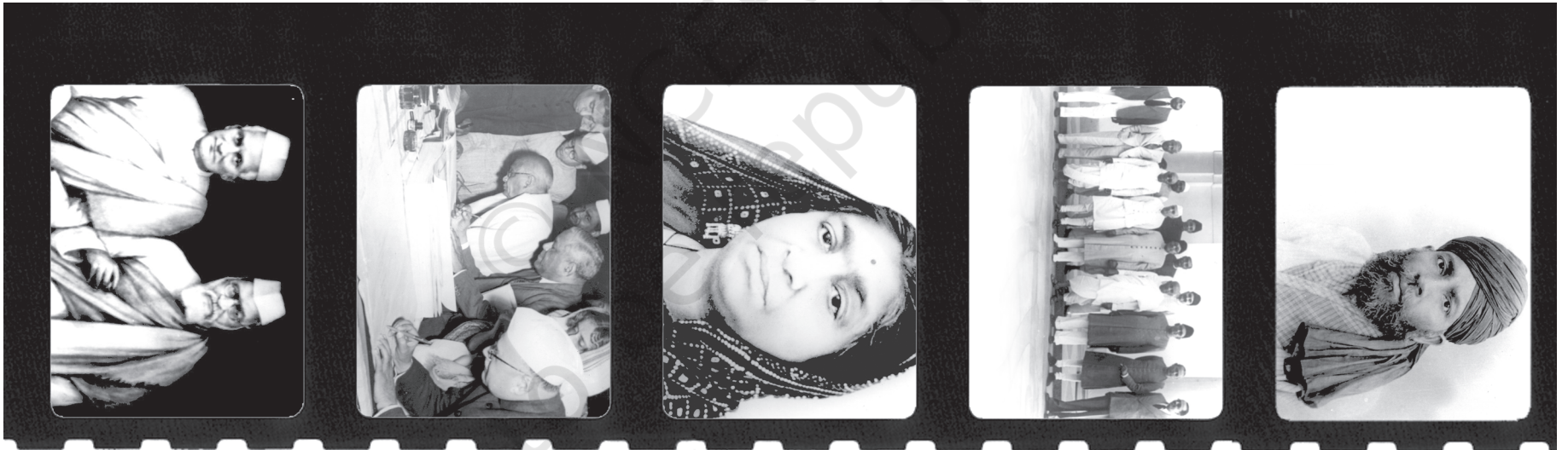
नेहरू मेमोरियल म्यूजियम एवं लाइब्रेरी, नई दिल्ली