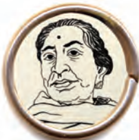
सरोजिनी नायडू (1879-1949) जन्म: आंध्र प्रदेश। कवयित्री, लेखिका और राजनैतिक कार्यकर्ता। कांग्रेस की अग्रणी महिला नेता। बाद में: उत्तर प्रदेश की राज्यपाल