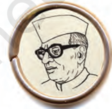
कन्हैयालाल माणिकलाल मुंशी

(1901-1961), जन्म: हरियाणा। सफल उद्यमी और पंजाब विधानसभा में पंथक अकाली पार्टी के नेता। संविधान सभा में कांग्रेस द्वारा मनोनीत। बाद में: केंद्रीय मंत्रिमंडल में रक्षा मंत्री।