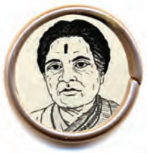
जी. दुर्गाबाई देशमुख (1909-1981), जन्म: आंध्र प्रदेश। वकील और महिला मुक्ति कार्यकर्ता। आंध्र महिला सभा की संस्थापक। कांग्रेस की सक्रिय नेता। बाद में: केंद्रीय समाज कल्याण बोर्ड की संस्थापक अध्यक्ष।