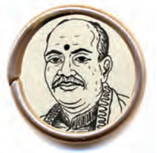
श्यामा प्रसाद मुखर्जी

(1887-1971), जन्म: गुजरात। वकील, इतिहासकार और भाषाविद्। कांग्रेसी नेता और गांधीवादी। बाद में: केंद्रीय मंत्रिमंडल में मंत्री। स्वतंत्र पार्टी के संस्थापक।