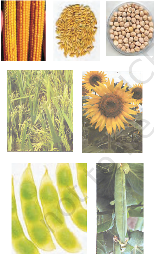
चित्र 15.1: विभिन्न प्रकार की फसलें

ऊर्जा की आवश्यकता के लिए अनाज; जैसे-गेहूँ, चावल, मक्का, बाजरा तथा ज्वार से कार्बोहाइड्रेट प्राप्त होता है। दालें जैसे चना, मटर, उड़द, मूँग, अरहर, मसूर से प्रोटीन प्राप्त होती है और तेल वाले बीजों; जैसे-सोयाबीन, मूँगफली, तिल, अरंड, सरसों, अलसी तथा सूरजमुखी से हमें आवश्यक वसा प्राप्त होती है (चित्र 15.1)। सब्जियाँ, मसाले तथा फलों से हमें विटामिन तथा खनिज लवण, कुछ मात्रा में प्रोटीन, वसा तथा कार्बोहाइड्रेट भी प्राप्त होते हैं। चारा फसलें; जैसे-वर्सीम, जई अथवा सूडान घास का उत्पादन पशुधन के चारे के रूप में किया जाता है।