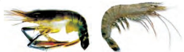
मेक्रोब्रेकियम रोजेन वर्गी (ताजा पानी) पीनस मोनडोन (समुद्री)

भविष्य में समुद्री मछलियों का भंडार (stock) कम होने की अवस्था में इन मछलियों की पूर्ति संवर्धन के द्वारा हो सकती है। इस प्रणाली को समुद्री संवर्धन (मेरीकल्चर) कहते हैं।